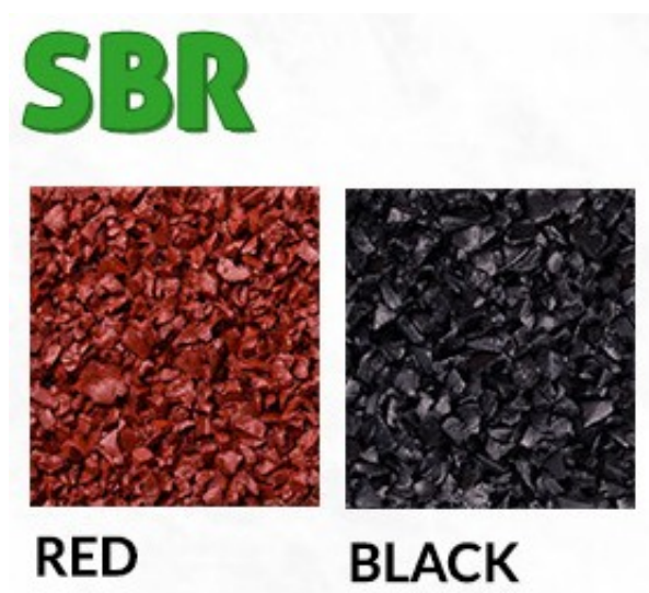
Rys. 5. Dostępna kolorystyka osłony trampoliny - SBR