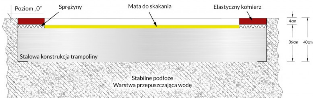
Rys. 6. Montaż trampoliny.