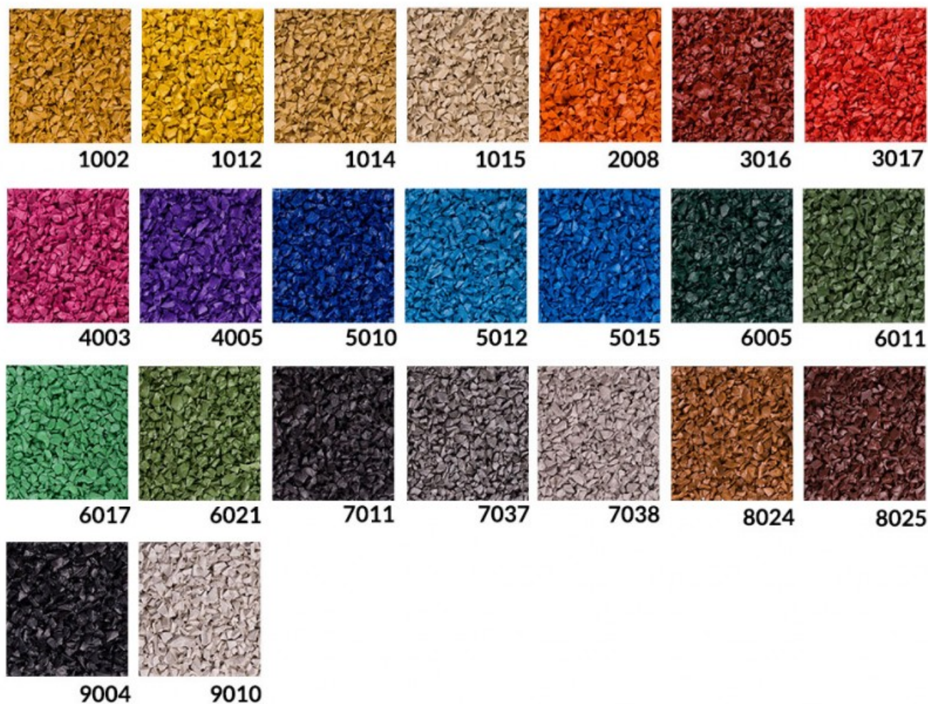
Rys. 4. Dostępna kolorystyka osłony trampoliny - EPDM