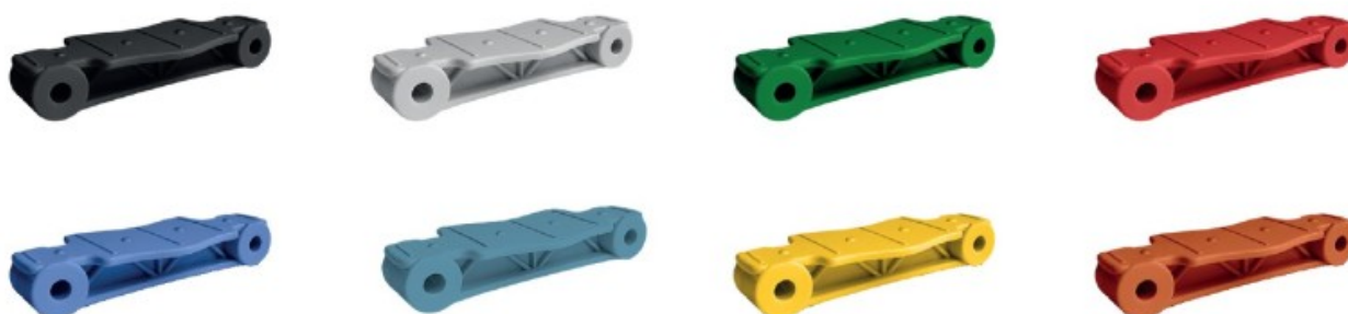
Rys. 3. Dostępna kolorystyka lamelek